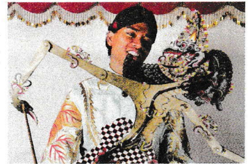
by Taichi Yuthei