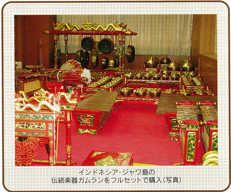
インドネシア・ジャワ島の 伝統楽器ガムランをフルセットで購入(写真)