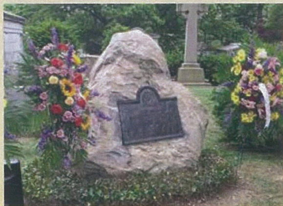
ウッドローン墓地に眠る野口英世博士の墓