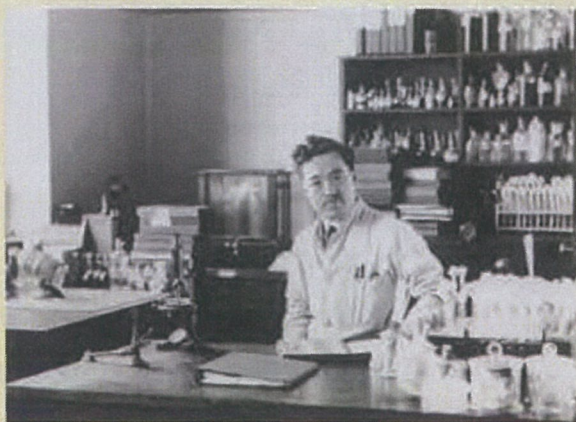
ロックフェラー医学研究所の研究室での野口英世博士

野口博士は、ニューヨーク・ブロンクス区のウッドローン墓地に埋葬されています。墓碑銘には「博士は、科学への献身により、人類のために生き、人類のために死せり」と書かれています。なお、野口博士は、日本の科学者として初めて日本のお札(1000円札)の肖像に選ばれました(2004年)。