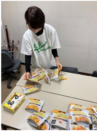
食品のスペシャリスト・蕪木教授のチェック。