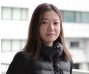
経営学専攻 博士課程前期課程1年